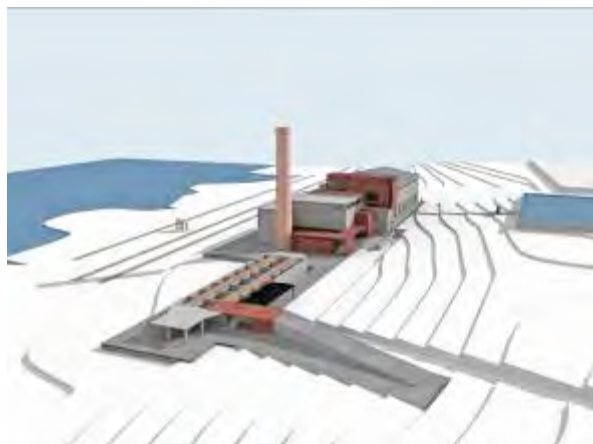
2. Proyecto de Adaptación de la Central Térmica de Corrales a Centro Cívico (vistas exteriores)

No se pretendía engañar al observador con un presente ficticio. Y fue así como surgió el proyecto de reconversión funcional de la Central Térmica a Centro Cívico .