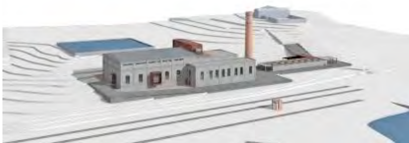
3. Proyecto de Adaptación de la Central Térmica de Corrales a Centro Cívico (vistas exteriores)