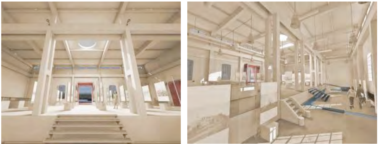
3. Proyecto de Adaptación de la Central Térmica de Corrales a Centro Cívico (vistas interiores)

El orden interno del edificio se mantiene y se redistribuyen los espacios dentro de los volúmenes existentes encajando nuevas piezas que pretenden completar y perfeccionar los nuevos usos de la Central Térmica como Centro Cívico.