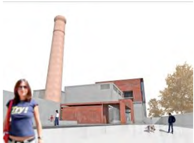
1. Proyecto de Adaptación de la Central Térmica de Corrales a Centro Cívico (vistas exteriores)

Probablemente uno de los primeros edificios construidos en hormigón armado de la provincia, la Central dispone distintos espacios para la producción de electricidad de manera funcional pero sin dejar atrás la calidad del diseño. Este hecho junto con la riqueza ambiental del entorno de las Marismas del Odiel (actualmente contaminadas y en absoluto abandono en la parte limítrofe de Corrales) permitía plantear enormes posibilidades a unas instalaciones (aunque para algunos técnicos resultaban ser ruinas).