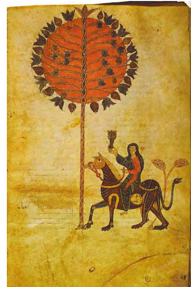
Ende. Beato de Gerona

La primera artista de la que se tiene mención en nuestro país es Ende. La vida de Ende aparece rodeada de un profundo misterio: sólo podemos reconocer su condición femenina a través de la referencia a su nombre que figura en las últimas páginas del "Beato de Gerona" (975), uno de los manuscritos ilustrados que, siguiendo la tradición carolingia por un lado, y la bizantina por otro, se realizaron en España desde el siglo IX.