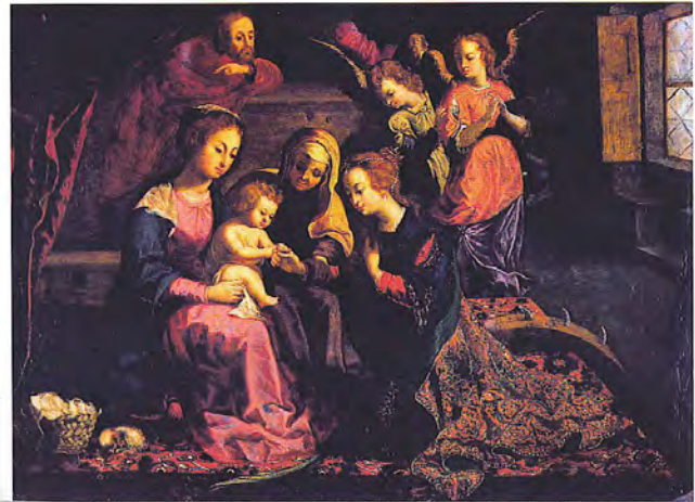
Josefa de Ayala

retrato italiano y el español del siglo XVI, así como su naturalismo igualmente innovador. De ella sería, entre otros, el retrato más conocido de Felipe II que le representa con un austero atuendo negro y un rosario en la mano izquierda, entre otros retratos importantes. Todas sus obras carecen de firma, por lo que se han atribuido a otros artistas, especialmente a Sánchez Coello, con quien mantuvo una dura competencia, ya que, en ocasiones la misma familia real llegó a imponerle el estilo, las "poses", etc. "a la manera de Sofonisba Anguissola" .