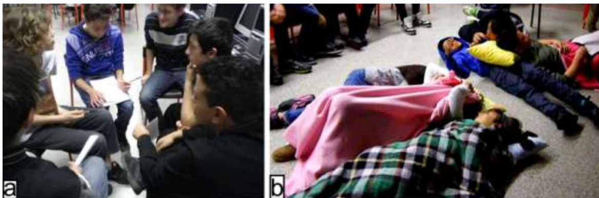
Fig. 2. a) Un grupo de estudiantes reunidos para planear una performance. b) Performance realizada por un grupo que consistía en la acción de dormir en clase.

apostarse del fondo de la clase a la primera fila para seguir mejor e hizo muchas preguntas manifestando curiosidad y sorpresa.